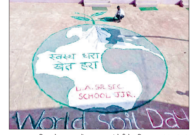
झज्जर। मृदा दिवस के उपलक्ष्य में बनाया गया रंगोली रेखाचित्र।