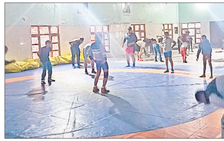
बहादुरगढ़। व्यायामशाला के हॉल में अभ्यास करते युवा पहलवान।