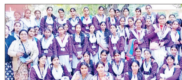
बहादुरगढ़। शैक्षिक भ्रमण के तहत कुरुक्षेत्र पहुंची छात्राएं।

वैश्य आर्य कन्या वरिष्ठ माध्यमिक विद्यालय की 11वीं व 12वीं विज्ञान संकाय की छात्राओं को शैक्षिक भ्रमण के तहत कुरुक्षेत्र के पैनोरमा और साईंस सेंटर ले जाया गया। इस भ्रमण का उद्देश्य छात्राओं को विज्ञान, इतिहास और संस्कृति का प्रायोगिक ज्ञान उपलब्ध कराना रहा। साईंस सेंटर पहुंचने के बाद छात्राओं ने थ्री-डी मूवी के माध्यम से चंद्रमा के बनने की रोचक प्रक्रिया को समझा। मूवी में बताया गया कि कैसे करोड़ों वर्ष पूर्व पृथ्वी के निर्माण काल में घटित घटनाओं से चंद्रमा का निर्माण हुआ। दुर्घातक प्रस्तुति के माध्यम से छात्राओं ने वैज्ञानिक तथ्यों को गहराई से जाना। इसके बाद छात्राओं ने पैनोरमा के म्यूजियम का अवलोकन किया।