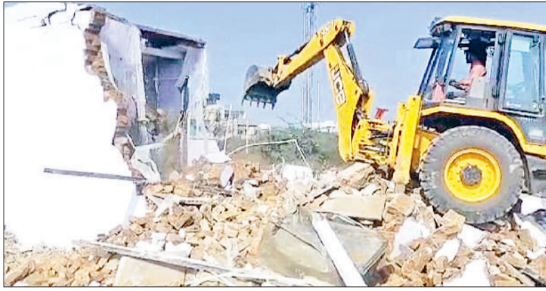
बहादुरगढ़। अवैध कॉलोनी में एक निर्माण को गिराती जेसीबी।

विभाग को सूचना मिली थी कि लाइनपार में अवैध कॉलोनी काटी जा रही है। इस पर डीटीपी ने कार्रवाई की योजना बनाई। शुक्रवार को टीम ने पुलिस बल के साथ दस्तक दी।