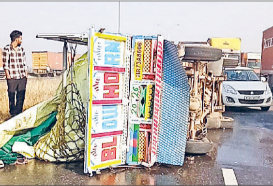
बहादुरगढ़। केएमपी पर पलटी पिकअप गाड़ी व एंबुलेंस में मौजूद दोनों घायल।

केएमपी एक्सप्रेस-वे पर गांव डाबोदा के निकट टायर फटने से मछलियों से भरी एक पिकअप गाड़ी पलट गई। इस हादसे में गाड़ी में मौजूद दो युवक बुरी तरह से घायल हो गए। उन्हें नागरिक अस्पताल में भर्ती कराया गया है।