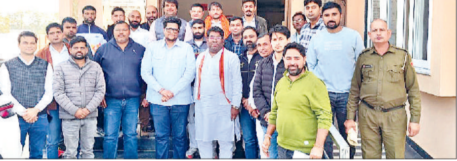
झज्जर। बैठक के उपरांत उपस्थित युवा मोर्चा प्रदेश उपाध्यक्ष, जिलाध्यक्ष एवं अन्य कार्यकर्ता।