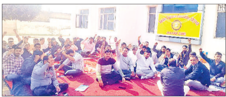
झज्जर। हड़ताल पर विभाग अधिकारियों के खिलाफ नारे लगाते हुए कनिष्ठ अभियंता।

रिंसाई विभाग कार्यालय परिसर में चल रही कनिष्ठ अभियंताओं की अनिश्चितकालीन हड़ताल शुक्रवार को ग्यारहवें दिन भी जारी रही। हड़ताल पर बैठे कनिष्ठ अभियंता अपने साथी जेई पर की गई चार्जशीट की कार्रवाई से नाराज हैं। कर्मचारियों का कहना है कि विभाग द्वारा बगैर किसी ठोस आधार के चार्जशीट जारी की गई है, जिसके विरोध में कर्मचारी हड़ताल पर हैं।