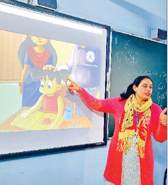
झज्जर। चित्रों के माध्यम से विद्यार्थियों को गुड और बैड टच के बारे में जानकारी देते हुए वक्ता।