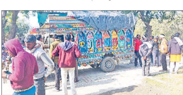
झज्जर। पोस्टमार्टम के बाद शव ले जाते हुए परिजन।